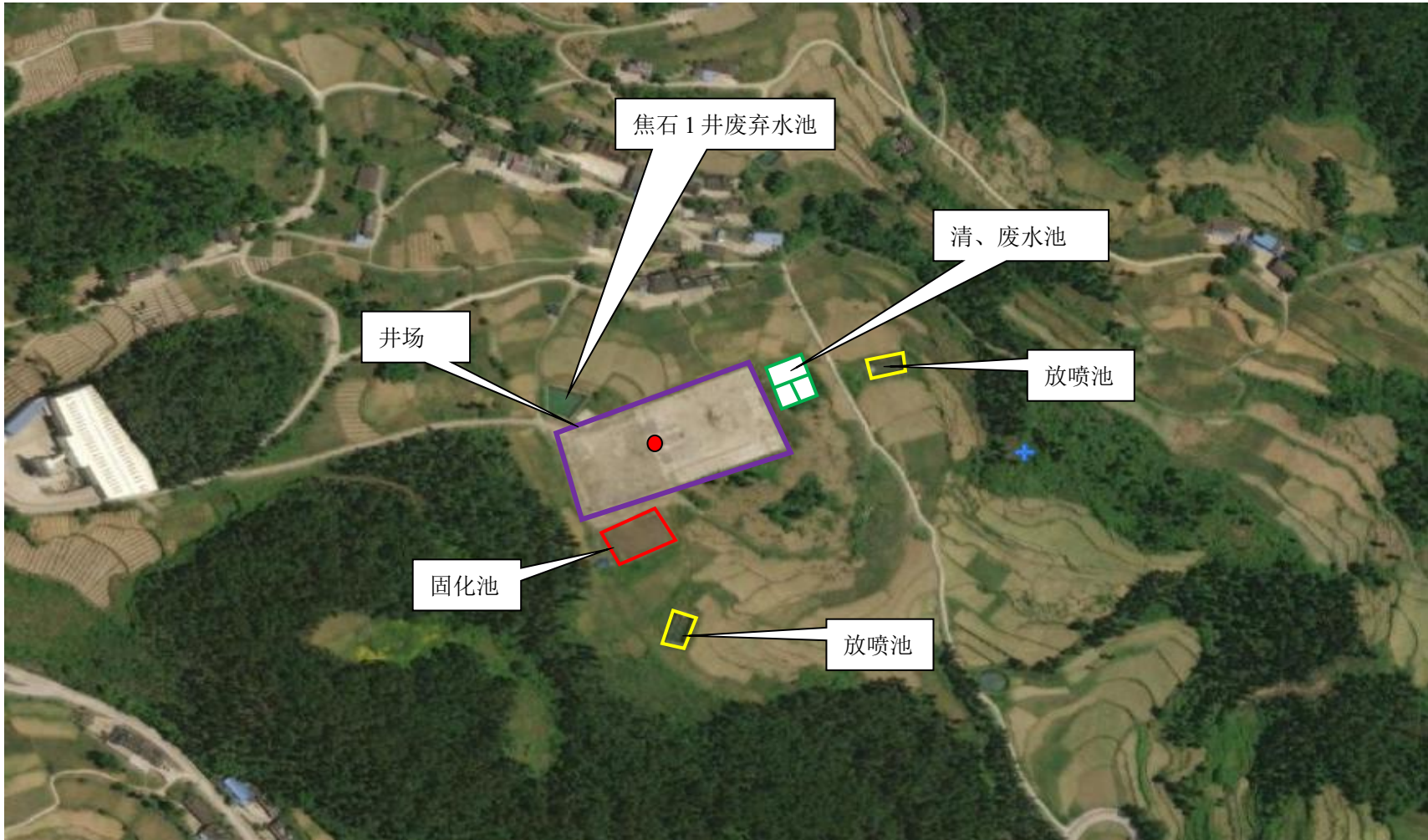
图 4-2 平面布置图