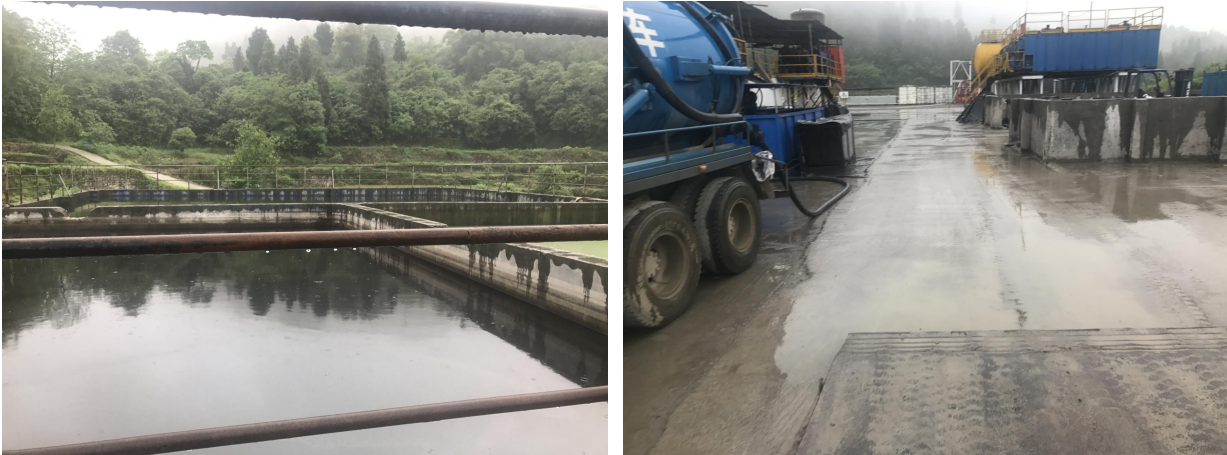
清、废水池（现状由于焦页 1-S8HF、焦页 1-S9HF 建设在用）井场现状+关键部位水泥硬化处理

根据建设单位提供的工程竣工资料，本项目施工期环境保护措施实施情况详见图 6-1~图 6-3。