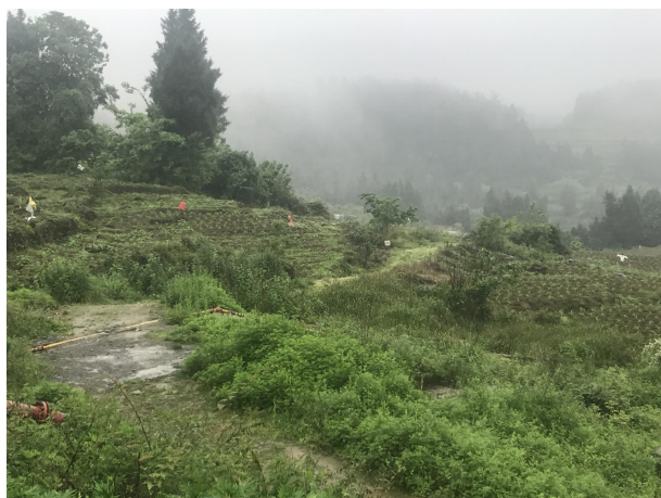
井场周边临时占地（生活区拆除后）植草绿化