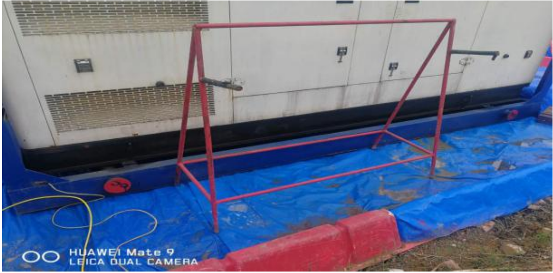
压裂罐区、设备防渗+围堰