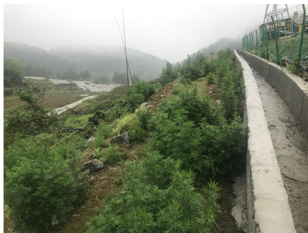
边坡撒草绿化及排水沟