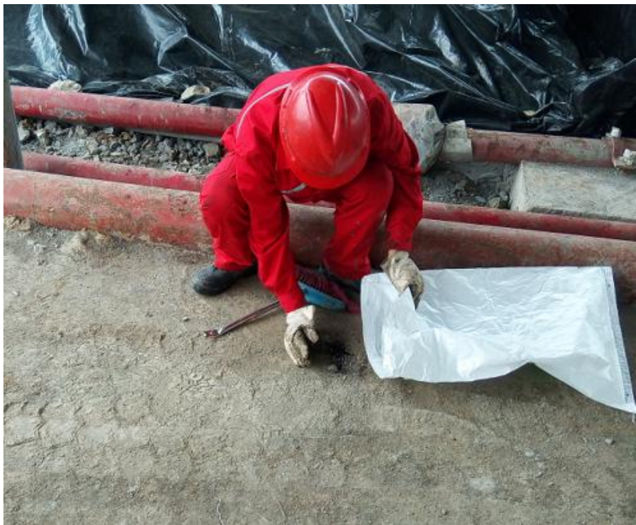
图 7-1 安全告知书发放及应急演练