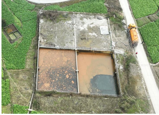
废水池（焦页 81 号）