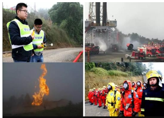
应急培训（建设单位）