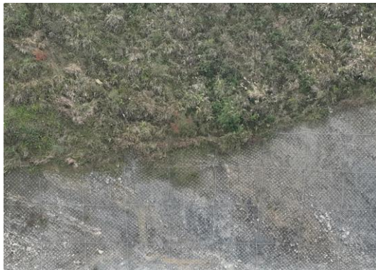
边坡防护+植被恢复（焦页 81 号西）

项目的建设未新增占地，不砍伐树木、不占用其他草地，仅施工生活区会临时占用少量耕地农作物和其他草地，目前建设完成，从现场调查来看，与环评时期植被类型基本一样。因此本项目的建设、运营过程均为对周边植被造成较大影响，且后续生态恢复将会使周边植被生长较好。