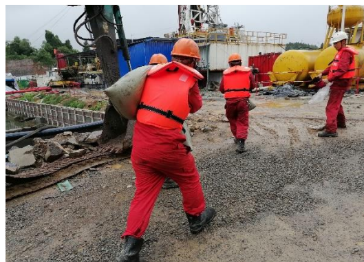
应急演练（施工单位）