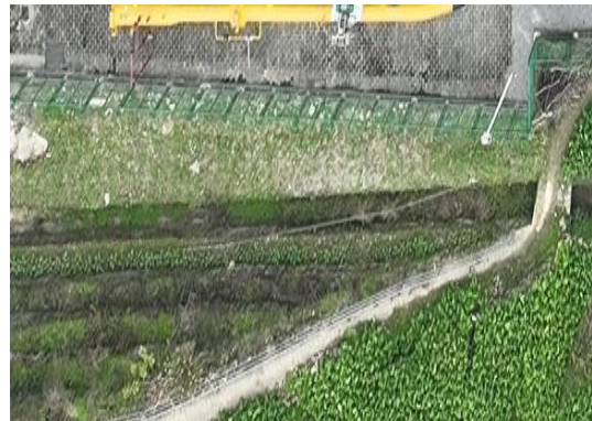
植被恢复（焦页 81 号西）