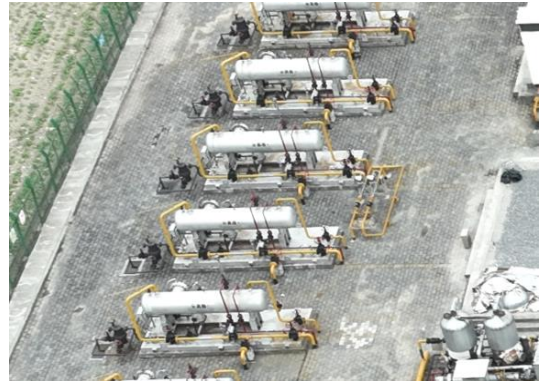
设备减振（焦页 81 号）