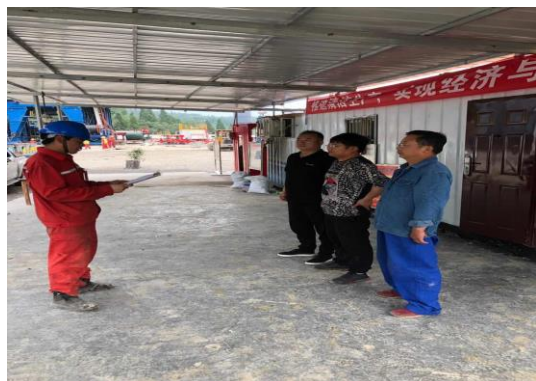
应急培训（施工单位）