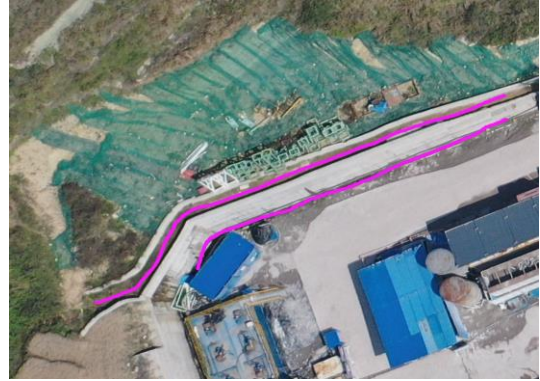
截排水沟（焦页 81 号西）