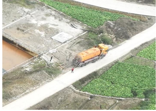
罐车拉运（焦页 81 号）