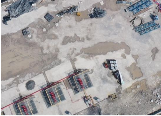
井场硬化（焦页 81 号西）