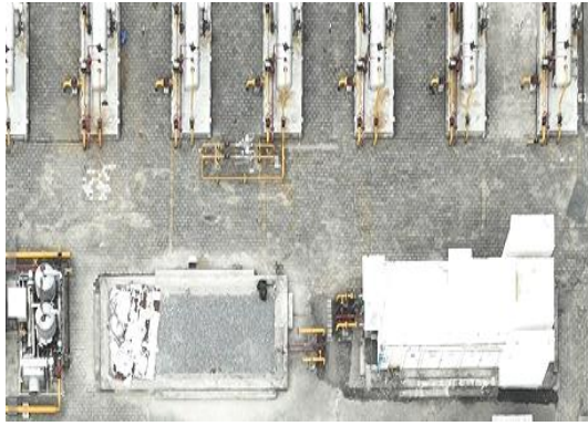
站场设备（焦页 81 号集气站）