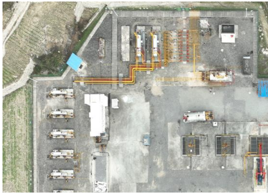
站场设备（焦页 81 号集气站）