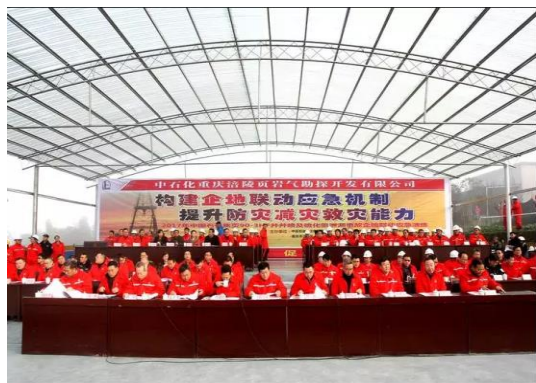
应急培训（建设单位）