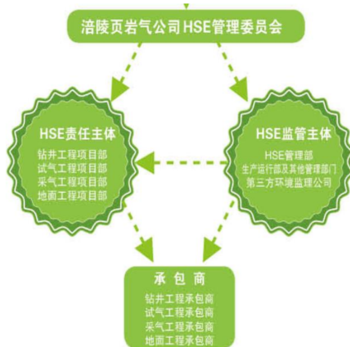
图 11.1-2 HSE 管理委员会架构

中石化重庆涪陵页岩气勘探开发有限公司始终致力于构建资源节约型和环境友好型企业，全力打造绿色气田。为严格落实在生产经营各环节的环境风险识别、环境保护措施，提升公司环境管理水平，强化环保依法合规管理，公司配备有较为完善的环境管理支撑机构。