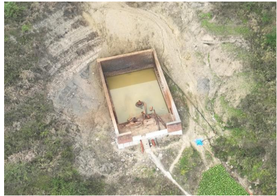
放喷池（焦页 81 号）