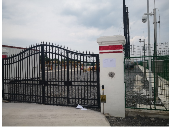
图 1 现场公示照片